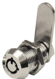
Cannon djupriggslås Art.nr. C1903020